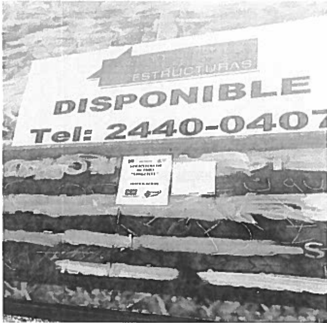
FOTO 4 VALLA PUBLICITARIA RETIRADA